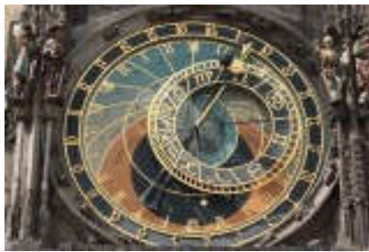
Αστρονομικό Ρολόι(Staromestska Radnice)

Το αστρονομικό ρολόι είναι αναμφίβολα το πιο θαυμαστό αξιοθέατο της πράγας. Το 2010 συμπληρώθηκαν ακριβώς 600 χρόνια από τη στιγμή που πρωτολειτούργησε. φανταστείτε, πόσα ζευγάρια ματιών διάβασαν από τότε την ώρα στο αστρονομικό ρολόι, πόσοι άνθρωποι παρακολούθησαν την «παρέλαση των αποστολών» και άκουσαν τον πετεινό να λαλεί.